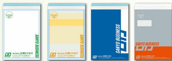
オフセット印刷 UVオフセット印刷 グラビア印刷 高輝度銀加工

紙封筒、透明ビニール封筒などの印刷。透明ビニール封筒の印刷には窓付き、より光沢がある内側印刷、おしゃれな両面印刷などがございます。